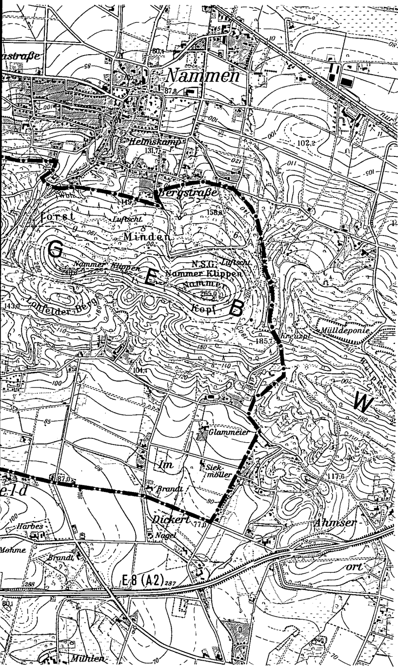
----- Kurgebietsgrenze Stadtteil Hausberge